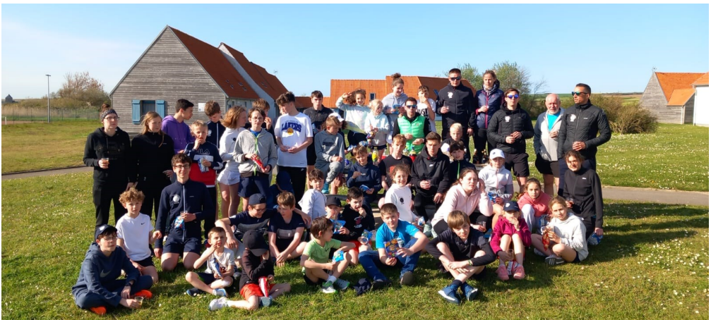
Stage à la Côte d'Opale