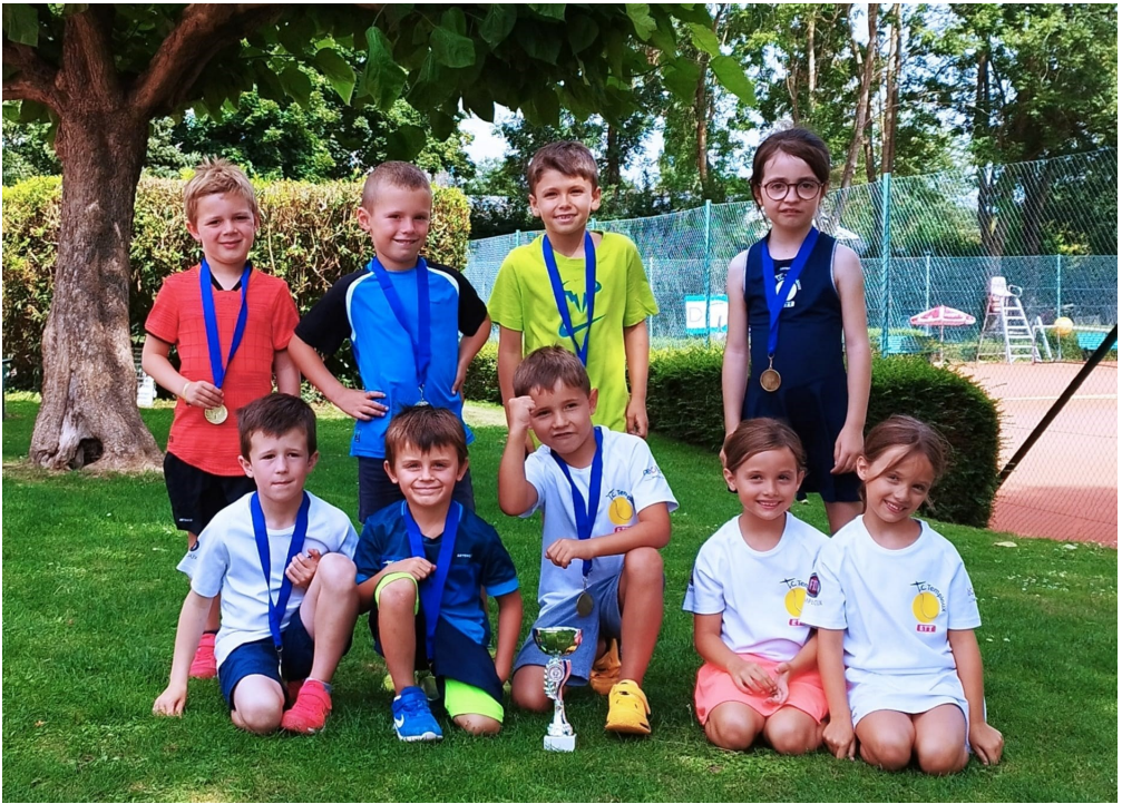
Lors d'un tournoi pour les petits (catégorie U7-U9)