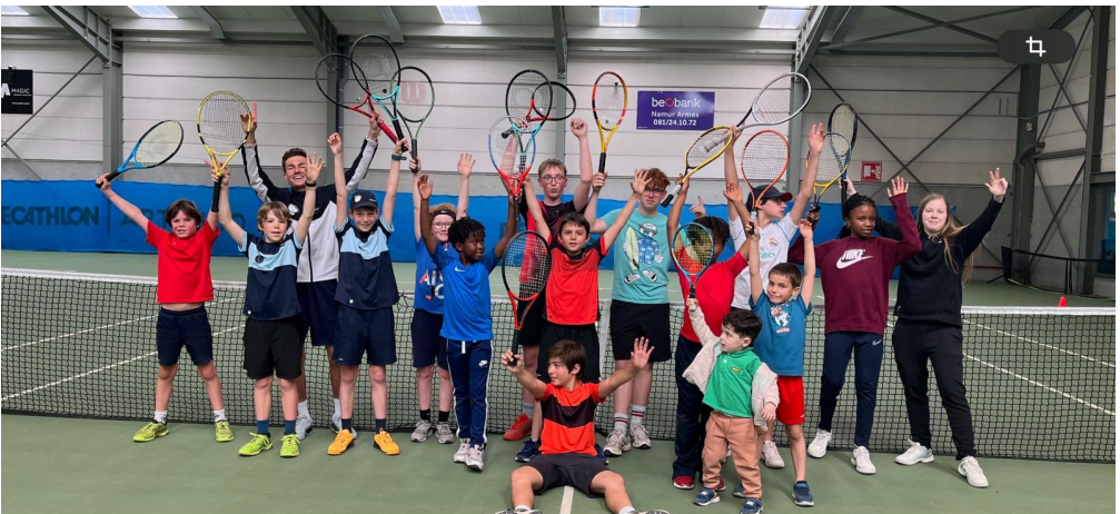
Lors d'un stage au club