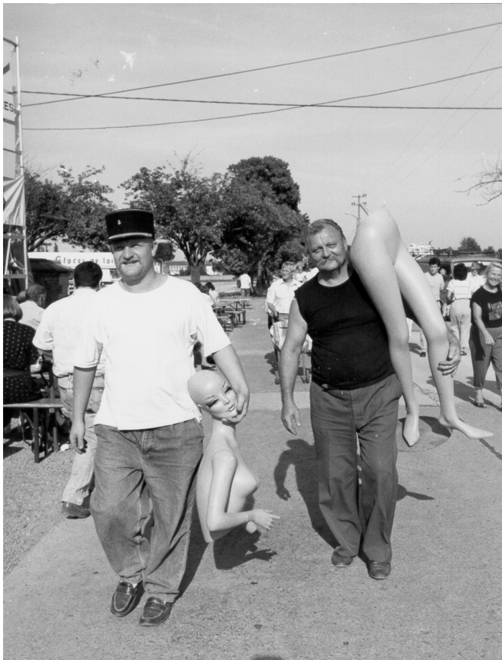
BROCANTE DE TEMPLoux - 20 AOÛT 1989 - SANS LEGENDE - (Photo VERS L'AVENIR).