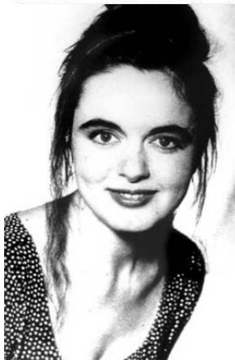
Amélie Nothomb

Amélie Nothomb a un nom célèbre. Après son enfance passée en Extrême-Orient, elle vit à Bruxelles. A 25 ans, elle publie son premier roman.