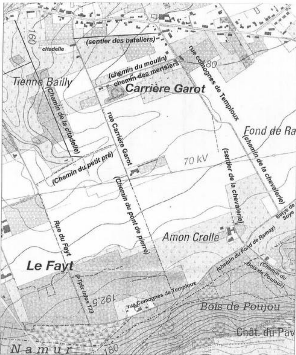
Fond de carte: carte topographique de l'Institut Géographique National (n°472 - 1996)

Les anciennes appellations (entre parenthèses et en italique) ont été reprises dans l'atlas des communications vicinales de 1844: