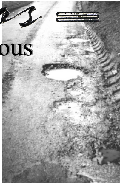
rue de la grande sambresse

A Temploux, mis à part l'éclairage du terrain de football et la mise à disposition des locaux communaux (en mauvais état eux aussi) situés près de la salle Saint-Hilaire, rien n'a été fait depuis 25 ans pour la vie associative et sportive. Temploux, village de plus en plus abandonné par les autorités communales !