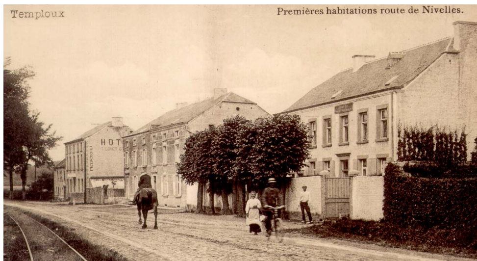
Photo datant de la même époque. On y découvre la maison Mauroy (n° 358) et le home Saint-Joseph qui ont été évoqués dans Temploux Infos .

Il est à peu près certain qu'en 1914, il n'y avait plus de brasserie à Temploux. En effet, les Allemands les avaient toutes réquisitionnées et aucune n'est renseignée à Temploux.