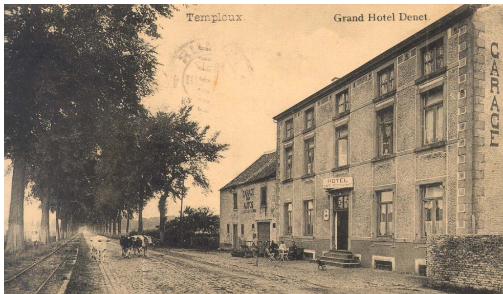
Photo prise entre 1912 et 1914. On n'a pas beaucoup d'explications sur les inscriptions GARAGE ou GARAGE POUR AUTOS (très peu nombreuses à l'époque). Les vaches occupent la chaussée en pavé sous l'oeil de quelques clients de l'hôtel, café et restaurant.