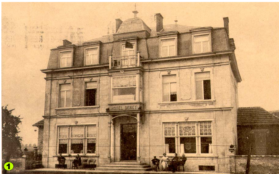
Cette photo a été prise avant 1926.