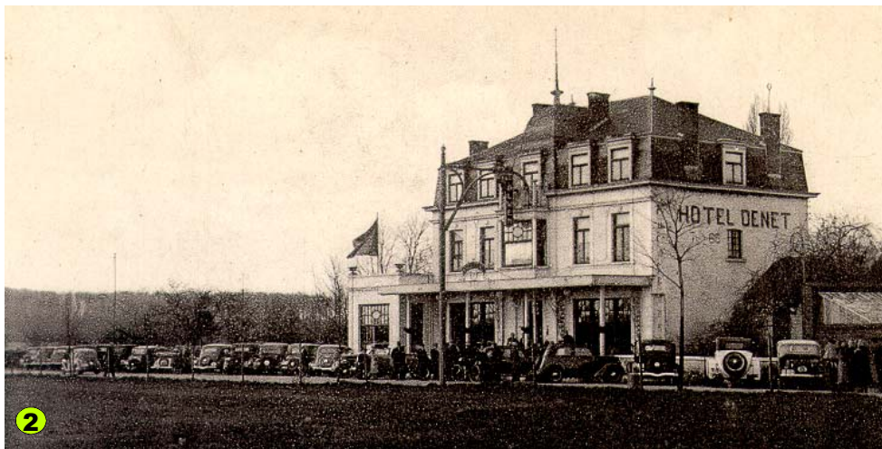
Le jour du dîner de cochons vers 1935.