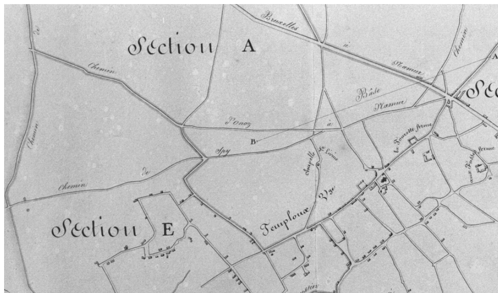
Tableau d'assemblage du Plan Cadastral parcellaire de la Commune de Temploux (1817)

Comme nous le faisait remarquer André Stevelinck, au XVIII e siècle, les chapelles servaient de « poteaux indicateurs » puisqu'elles se situaient aux carrefours de plusieurs directions; c'est le cas notamment des chapelles du Sacré-Cœur et Sainte-Wivinne .