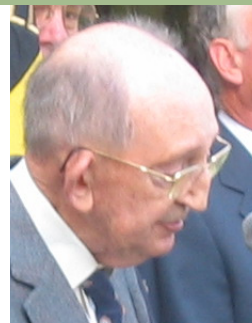
Anniversaire de la libération en 2004