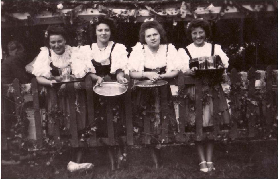
Première fancy-fair en 1942: la grande buvette