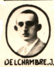
Tableau d'honneur de l'Armée secrète, groupe Jaguar (extraits)