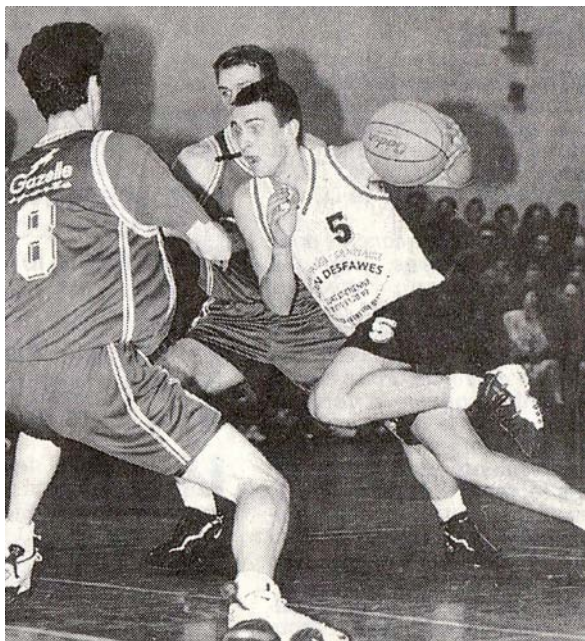
Vers l'Avenir - 4 avril 1998