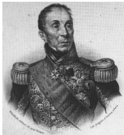
Maréchal comte DE GROUCHY 1766 - 1847

Commandant du 1 er Corps de la cavalerie française