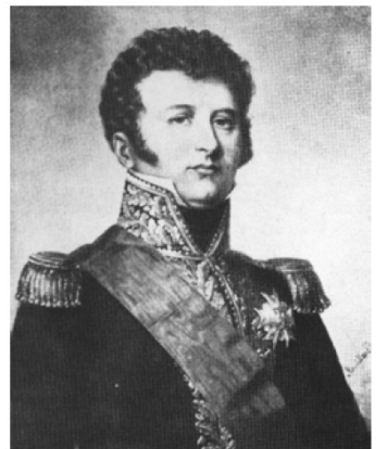
Lieutenant Général comte VANDAMME 1770 - 1830

De la Bavette (Bawette - château de la Bawette), le corps de Vandamme se replia à Wavre, y resta en position assez tard et marcha ensuite par Dion-le-Mont,