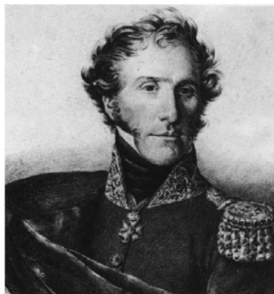
Lieutenant - Général TESTE

Ce n'est qu'à près de sept heures du soir, que j'ai reçu la lettre du duc de Dalmatie, qui me prescrivait de marcher sur Saint-Lambert, et d'attaquer le général Bulow. J'avais rencontré l'ennemi en me portant sur Wavre, à la hauteur de la baraque. Sur-le-champ il avait été abordé, poussé jusques dans Wavre, et le corps Vandamme attaquait cette ville et était