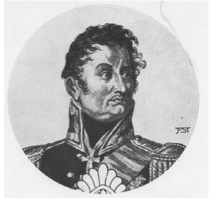
Lieutenant - général VON THIELMANN

Pendant ce temps, le IV e corps qui a désormais la route libre, gagne Namur avec les blessés et le parc.