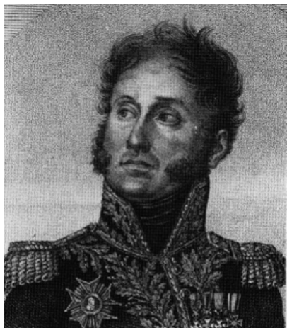
Général comte PAJOL

Le 17 juin au matin, Exelmans aperçoit les Prussiens qui abandonnent leurs positions et en avertit Grouchy. L'idée est que les Prussiens font retraite vers Perwez, alors que les différents corps d'armée en déroute ont été regroupés par l'état major et rejoignent Wavre.