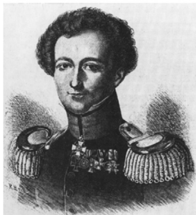
Colonel VON CLAUSEWITZ

Les illustrations-portraits repris dans ces pages proviennent des collections de mon frère, Jacques Stevelinck.