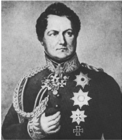
Lieutenant-Général comte Neithardt VON GNEISENAU 1780 - 1831

Le 16 juin à 15 heures, le champ de bataille s'étend de Wagnelée à Balâtre. Le canon se fait entendre jusqu'au fond des chaumières de toute l'entité de Temploux. A 19 heures 30, sous le couvert d'une violente préparation d'artillerie, la garde à pied et à cheval appuyée par les cuirassiers de Milhaud, s'empare de Ligny et fait brèche dans la ligne de résistance adverse.