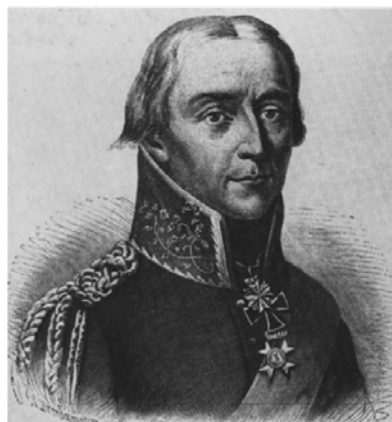
Lieutenant-Général comte BULOWW VON DENNEWITZ 1755 - 1816