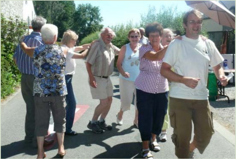
Fête Sainte-Wivine , le 4 juillet 2010.