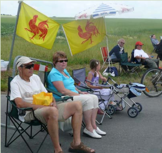
Le Tour de France à Temploux le 6 juillet 2010.