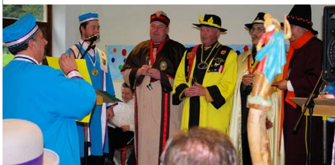
Ci-dessus : lors du marché aux anciennes variétés en 2003 à Namur.