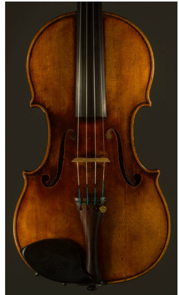
Violon réalisé en 1917 par Charles Poncin.

LA SALLE SAINT-HILAIRE LOCATION: 56.86.07