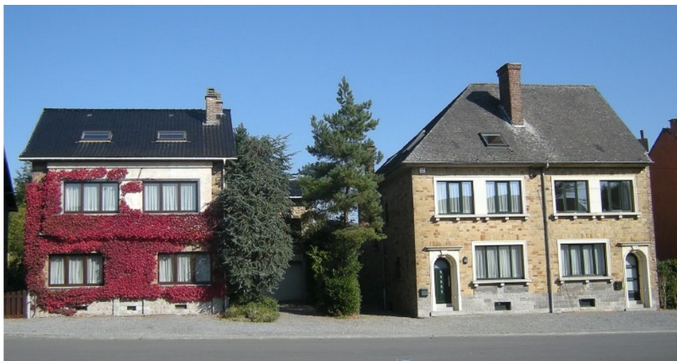
De gauche à droite la maison qui abritait le Café de la Place (n° 5) et les maisons n os 7 et 9 en 2008 www.bia-bouquet.com