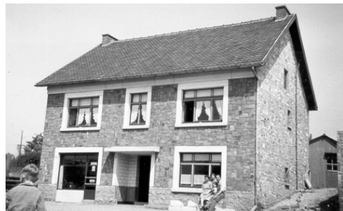
Le n° 3 en construction et ensuite, avec le magasin au rez-de-chaussée.