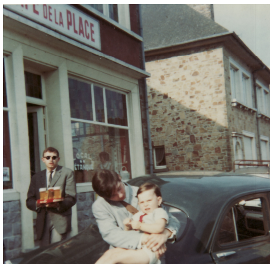
Le Café de la Place au n° 5.