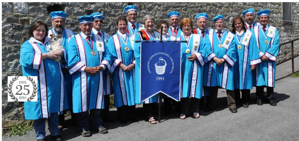
Les membres actuels de la Confrérie temploutoise des fabricants de vins de fruits