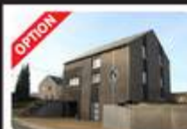
Maison: SAINT-GERARD Prix: faire offre à pd 169.000 €