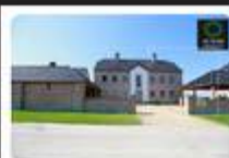
Maison: TEMPLOUX Prix: 309.000 €