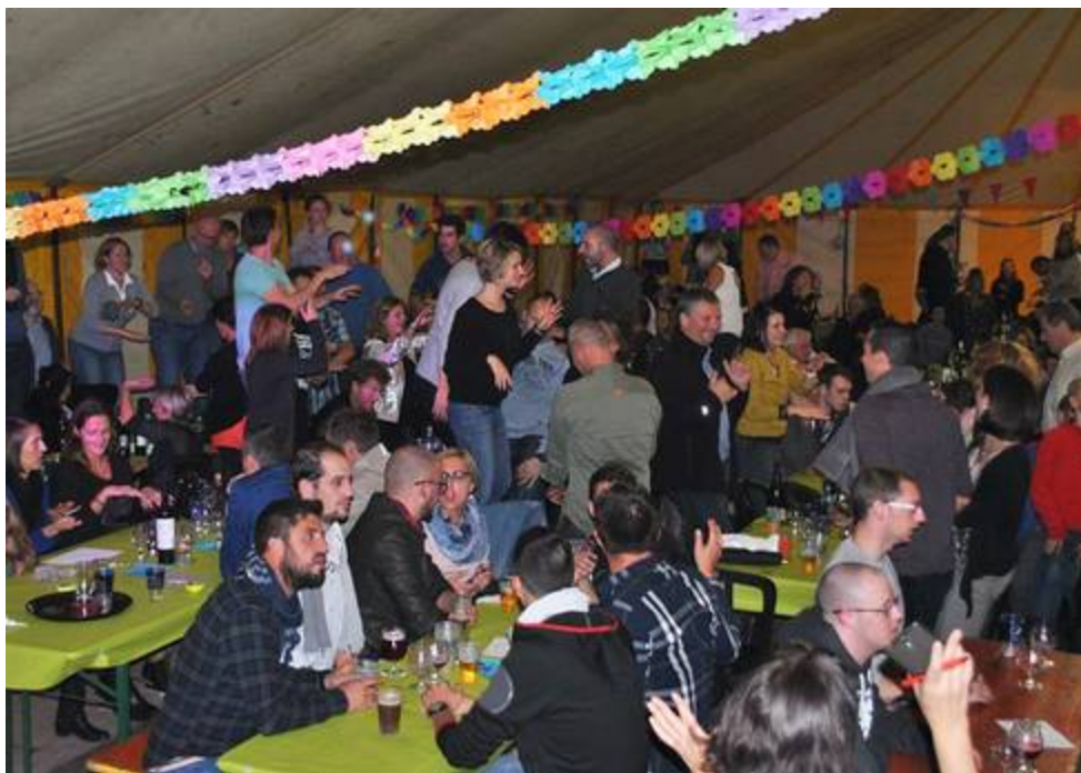
Ambiance du tonnerre pour la soirée des 25 ans du Tennis Club Temploux le 8 octobre.

Créée en 2012, elle initie les jeunes au tennis et leur fait découvrir le plaisir de jouer. Elle a pour but d'organiser des cours, des stages, de la compétition et des activités sportives en partenariat avec le TC Temploux et la brocante. Afin d'évoluer, elle doit sans cesse innover pour offrir de nouvelles activités, dans un esprit de convivialité et de fair-play. 170 jeunes sont encadrés par sept professeurs. En plus des cours programmés le mercredi après-midi et le samedi, le club organise des stages d'été. Tous les détails se trouvent sur www.tenniscool-temploux.be .