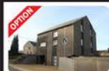
Maison: SAINT-GERARD Prix: faire offre à pd 169.000 €