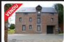
Imm. de rapport: SAUVENIERE Prix: vendu

ACTESIA Immobilière | Chaussée de Nivelles 335 | 5020 TEMPLLOUX Mobile: 0471 230 230 | Fax: 081 849 300 | email: laurence.ghigny@actesia.be