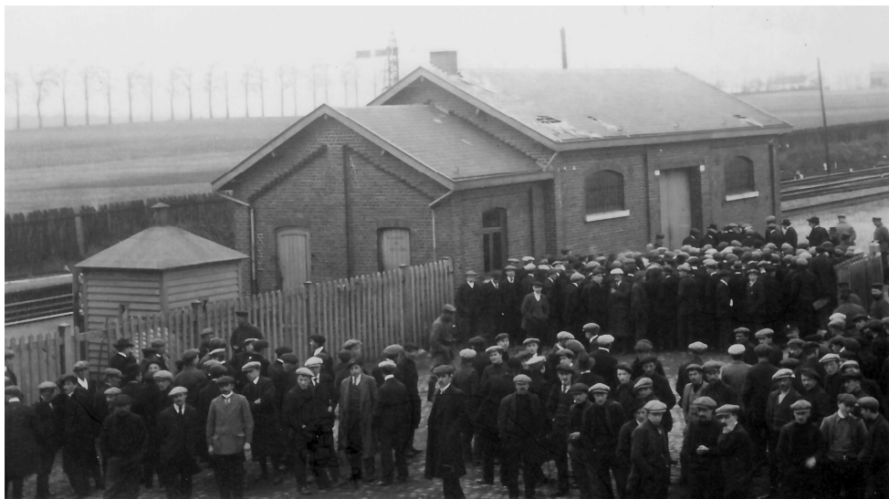
Gare de Rhisnes – départ des déportés.

C'est par voie d'affiche et sur ordre du Kreischef (chef de district) que 64 hommes de Temploux âgés de 18 à 55 ans reçoivent l'injonction de se présenter à Rhisnes dans le local « La maison des œuvres » le 29 novembre 1916.