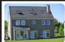
Maison: MEHAIGNE Prix: faire offre à pd 425.000 €