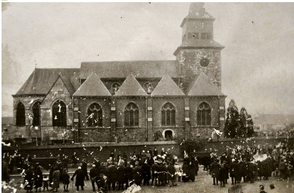
Temploux, fit une cérémonie aux cinq déportés morts en captivité. Voir également la photo suivante.

Ce rapport de 28 pages de récit, de souffrance, de violence, de brutalité est à votre disposition pour information, au musée de Temploux le troisième mercredi du mois à partir de 20 heures.