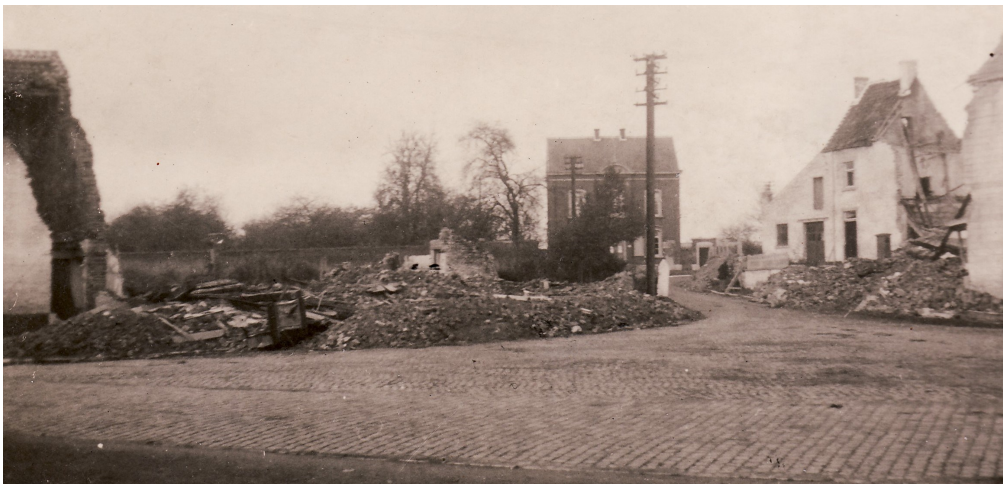
La place communale après le bombardement de mai 1940. A l'arrière plan, la maison communale.